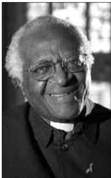
Obispo Desmond Tutu.

La celebración ecuménica, a la que asistieron la Reina Margarita II de Dinamarca, miembros del Gobierno Danés, participantes de la cumbre de las Naciones Unidas