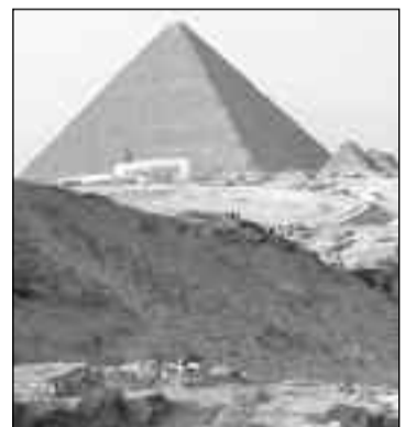
Las tumbas se encuentran muy cerca del sitio donde están emplazadas las pirámides.

Los hombres eran empleados por períodos de tres meses y las tumbas que los investigadores