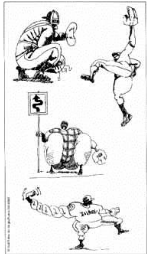
Las ilustraciones acompañaron al presente artículo en la edición impresa de la revista