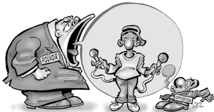
DAMIEN GLEZ® / CARTOONING FOR PEACE