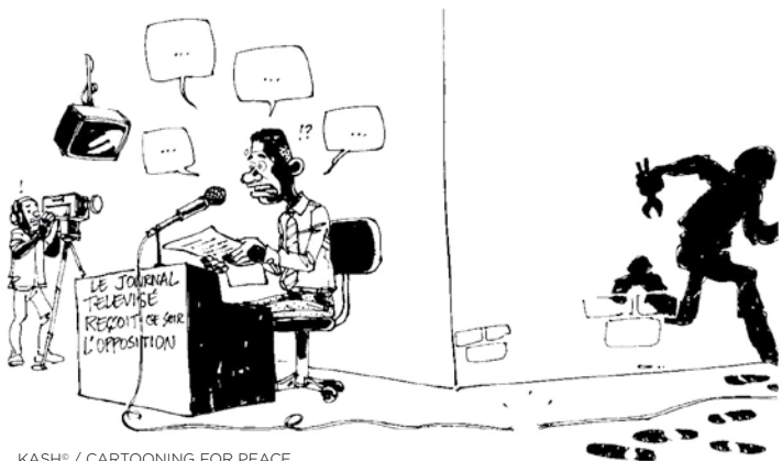
KASH® / CARTOONING FOR PEACE