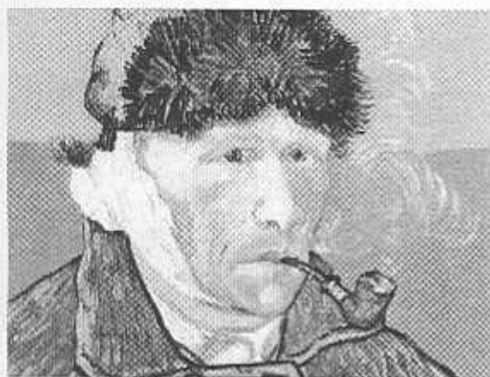
Detalle. Auto retrato de enera con la cabeza vendada. [1889]

dría concluirse, entonces, que en el androcentrismo, como elaboración teórica sobre el funcionamiento de la sociedad, se encuentran expresados el sexismo, el racismo y el viejismo, como prácticas cotidianas de la vida social.