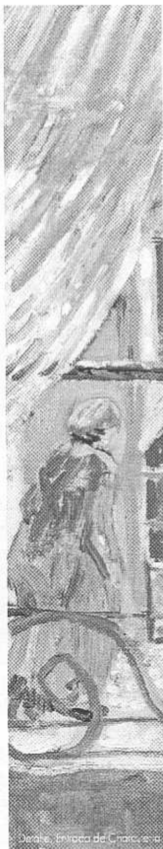
Jerale, Entrada de Caracas