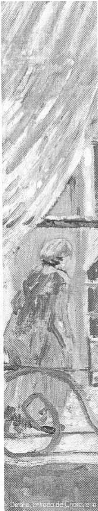
Dorotea, Entrada de Caracas