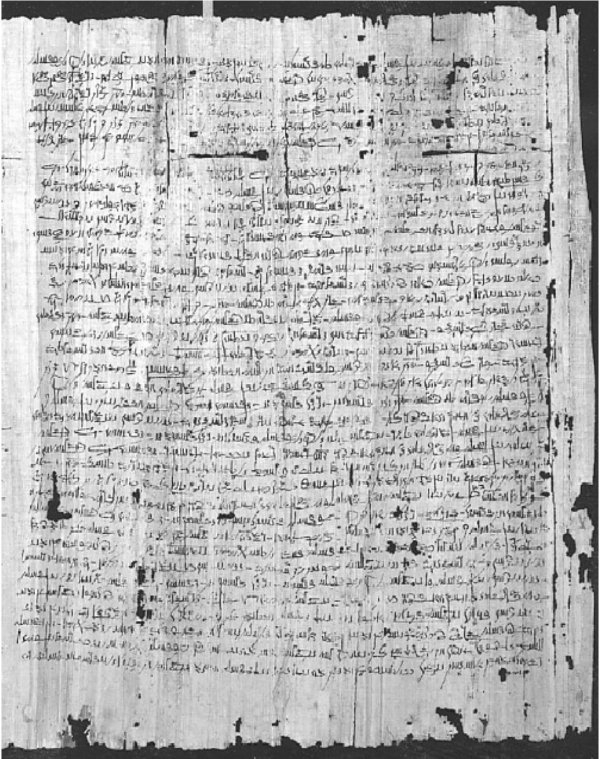
Reverso do papiro demótico EA 10822 contendo o relato egípcio.