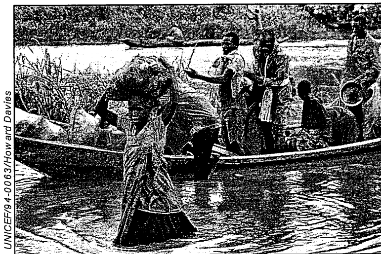
Tanzanie Réfugiés rwandais