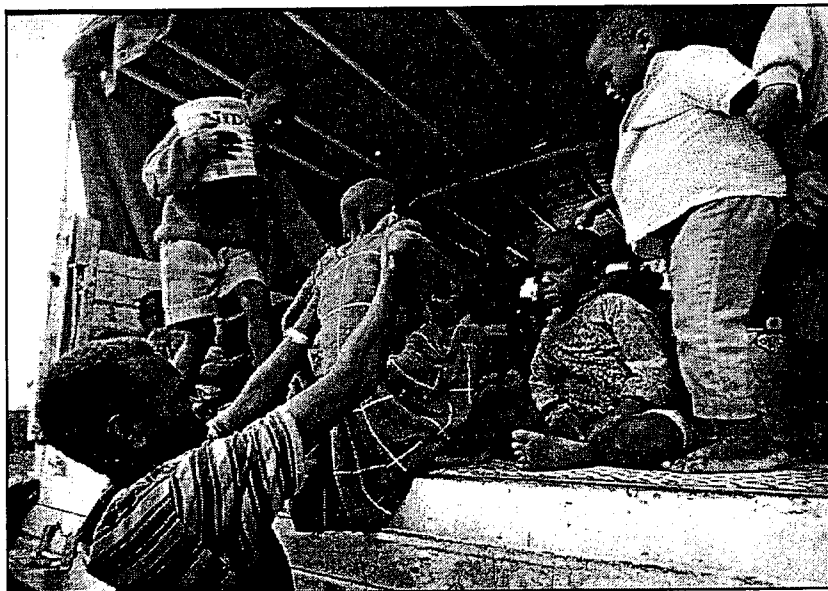
Une petite fille séparée de ses parents est mise dans un camion qui l'emmènera dans un orphelinat.