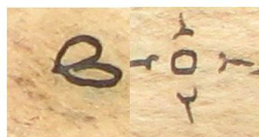
Tanda ini digunakan untuk mengawali kalimat baru di halaman 54 dan 215

Warna tinta yang digunakan untuk menulis adalah warna hitam dan merah, cap dalam kertas tidak ada, berbentuk buku di jilid menggunakan benang, dan tahun menuliskannya tidak di ketahui akan tetapi di akhir halaman di tengah kalimat ada tulisan angka 1785 tahun Jawa jika dimasehikan menjadi 1857 masehi. 6