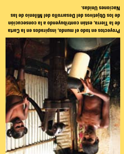
Proyectos en todo el mundo, inspirados en la Carta de la Tierra, están contribuyendo a la consecución de los Objetivos del Desarrollo del Milenio de las Naciones Unidas.

La Comisión de la Carta de la Tierra supervisó el proceso internacional de consulta y de redacción, y estableció un consenso en torno al texto final de la Carta.