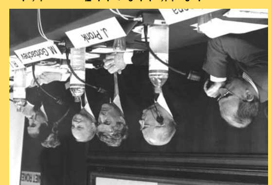
La Reina Beatrix de los Países Bajos participa en el lanzamiento de la Carta de la Tierra en el Palacio de la Paz, en junio del 2000, en La Haya.

La Comisión de la Carta de la Tierra supervisó el proceso internacional de consulta y de redacción, y estableció un consenso en torno al texto final de la Carta.