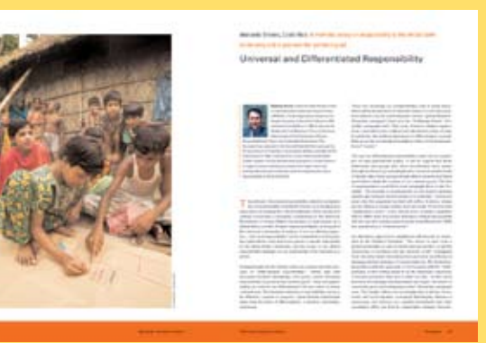
Este libro está colmado de palabras, fotografías y muestras de arte provenientes de todo el mundo y que son fuente de inspiración.