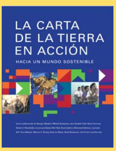
Portada, La Carta de la Tierra en Acción.

o contáctenos a Secretaría Internacional de la Carta de la Tierra y Centro Carta de la Tierra de Educación para el Desarrollo Sostenible en UPAZ C/o Universidad para la Paz Apartado Postal 138-6100 San José, Costa Rica Tel. (506) 2205 9000 Fax: (506) 2249 1929 Correo electrónico: info@earthcharter.org