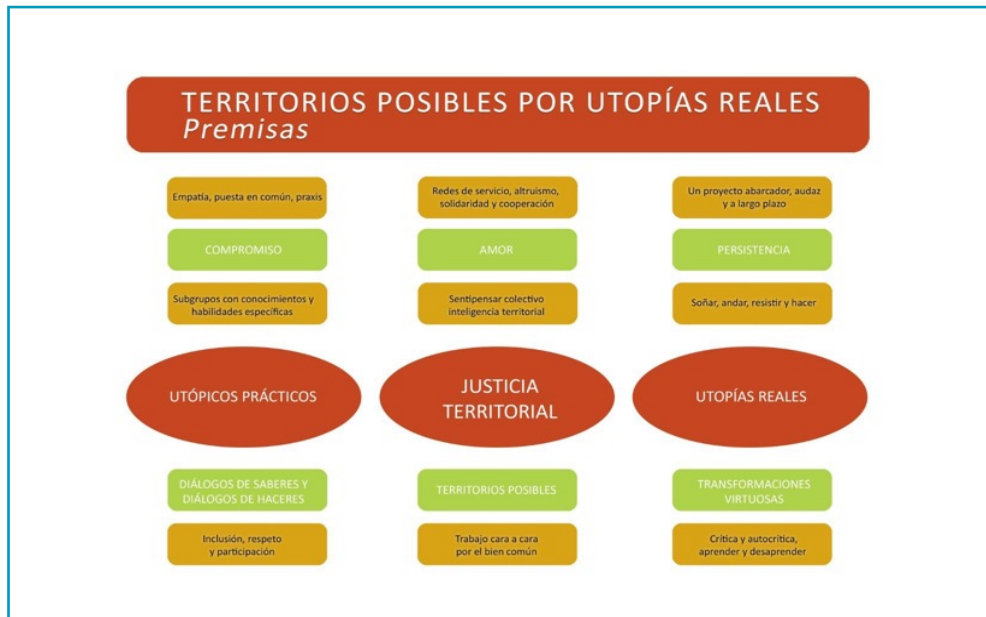
Figura 3. Premisas en “Territorios Posibles por Utopías Reales” (2020)

Las premisas de la JT promueven teorías transformadoras para transitar de los Diálogos de saberes (Freire, 1996) a los Diálogos de haceres (Bozzano y Canevari, 2020). A partir de esto, se comprende el lugar central que ocupan los “utópicos prácticos” y las “utopías reales” (ver figura 3).