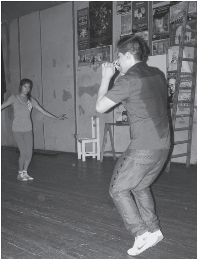
Ensayos de danzas indias en la Asociación de Artistas Aficionados, Lima.

promedio varía entre los 18 y 28 años, que en este caso resulta una diferencia generacional; son tanto mujeres como hombres (aunque habría que precisar mejor la proporción). Las razones por las que llegaron a bailar y a vestirse como los astros del cine popular indio más famosos son muy diversas.