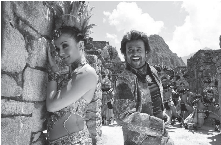
Escena de Enthiran , a los pies de las ruinas de Machu Picchu.

En cualquier caso, impresionan los números que maneja la industria del cine en la India, que produce desde hace décadas enormes cantidades de películas: más de 800 al año 2 , a las que se añaden cada vez más superproducciones, como por ejemplo Kabhi Khushi Kabhie Gham (Karan Johar, 2001), que se proyectó en Sudamérica bajo el nombre La familia hindú , o Enthiran [Robot] (S. Shankar, 2010), que rompió los récords de Bollywood con un presupuesto que bordeó los us$ 24 millones. El periodista John Boudreau señala que el costo de producción en la industria cinematográfica de la India es relativamente bajo, entre us$ 1 millón y us$ 4 millones en promedio, una bicocha si se compara con la industria californiana del cine, donde una película de us$ 20 millones es considerada low budget 3 . Otros apuntan que el sistema de producción del cine indio es una solución inteligente para ofrecer espectáculo de manera accesible a mucha gente; de hecho, el bajo costo de las entradas en la India así lo demuestra.