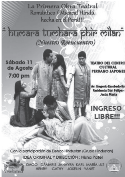
Afiche de la primera obra teatral hindú hecha en Perú.

contrasta con la frescura y normalidad ( Selbstverständnis ) con que nos apropiamos de elementos culturales foráneos y propios más diversos. Es un lenguaje quizá fuera de lugar, pero cómo explicar si no esa separación que se percibe entre los que escriben sobre cultura y los que la viven. Para este público, parece tratarse de una añoranza por un mundo de emociones que no está tan lejano a