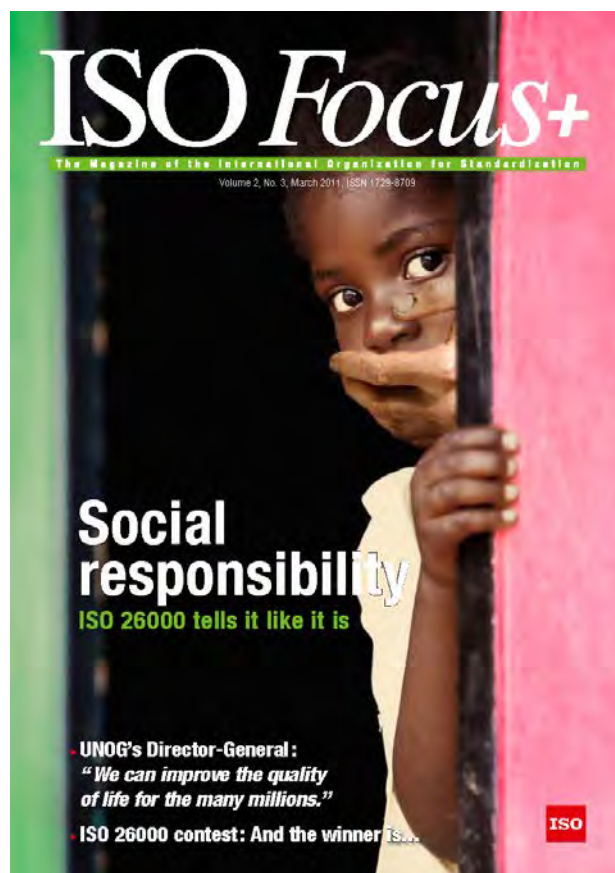
Titelseite von Iso Focus+ (2011), ISSN 1729-8709

Daran erkennt man, dass eine Orientierung der sozialen Verantwortung nicht nur frei-