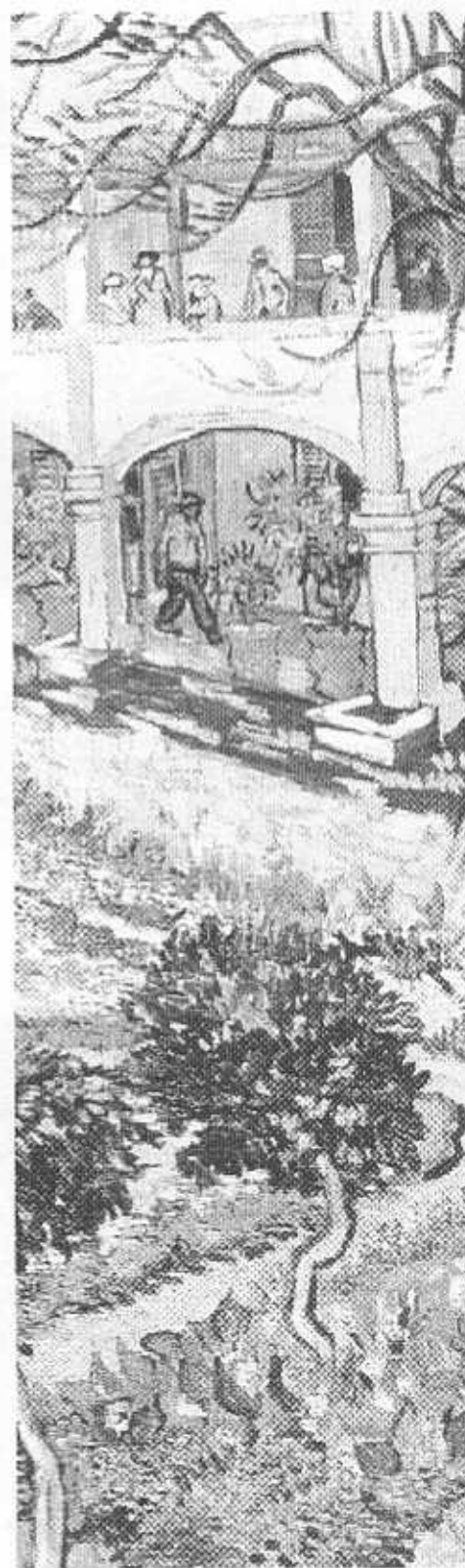
Detalle. El Patio del Hospital de Arles