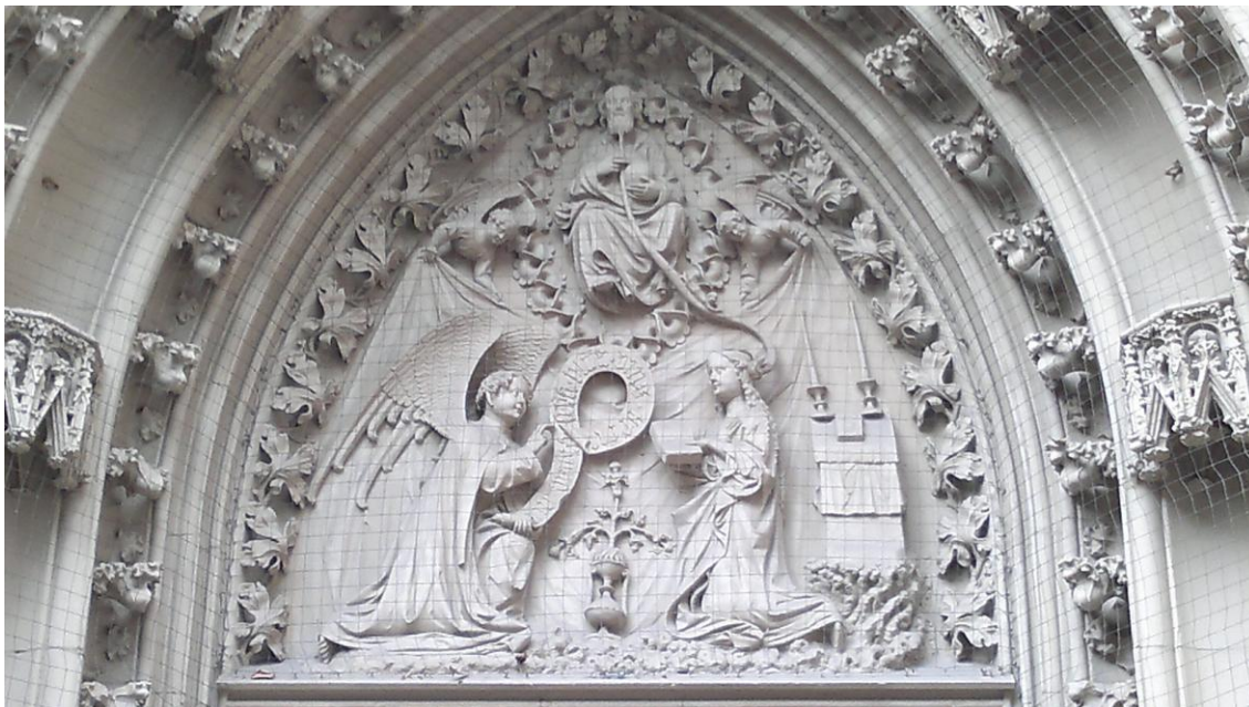
Una vieja tradición medieval, presentaba a la virgen María concibiendo a través del soplido del Espíritu Santo en su oído. El ángel presenta su discurso y María obedece. Foto de uno de los frontones de la catedral de Würzburg, Bayer, Alemania.