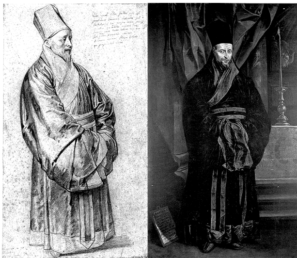
图 1 鲁本斯绘金尼阁着儒服素描(左)和油画(右),现藏斯德哥尔摩博物馆

实际上,在金尼阁从中国启程之前,龙华民就给他制定了一个详细的申请在中国设立图书馆的计划,其中第一步就是说服教皇同意设立并资助北京图书馆。为了达到这个目的,金尼阁将利玛窦遗著《基督教远征中国史》(即《利玛窦中国札记》)一书进呈教皇,并于 1615 年在德国奥格斯堡(Augsburg)出版。鉴于耶稣会在华传教取得的巨大成就,教皇很快就同意了在北京设立图书馆的建议,并捐赠了约 500 卷图书,此外,教皇和其他的耶稣会会长每人还捐赠了 1000 枚金币用于购书,显赫的美蒂奇(Medici)家族和哈布斯堡(Habsburg)家族的达官显贵们也都纷纷献上送给中国皇帝的礼物[(Sullivan,1970) 603 ,(Standaert,2003) 378-379 ,(Standaert,2007) 20 ]。