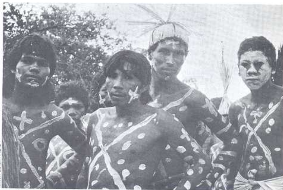
Milton Guran / AGIC

De acordo com o balanço atualmente realizado (PETI. Atlas das Terras Indígenas/Nordeste , 1993) são 23 povos indígenas, distribuídos em 43 áreas em seis estados (Bahia, Sergipe, Alagoas, Pernambuco, Paraíba e Ceará). As indicações sobre população apontam quase 40 mil, o que corresponde a 17% da população indígena no Brasil. Pernambuco, com aproximadamente 16 mil, tem um dos maiores contingentes indígenas (equiparando-se com o estado de Mato Grosso), vindo logo após