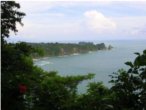
图 1：曼努埃尔·安东尼奥海岸区风景

这一部分为怎样执行地球宪章评估提供了一个实例。包括获取什么样的数据及以怎样的形式表达数据。它被分为以下几个部分：介绍；数据收集方法；所获信息的种类；表达数据的不同方式；建议和总结。