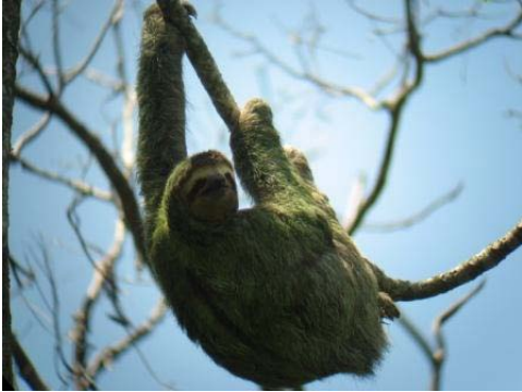
图 4：曼努埃尔·安东尼奥的生态多元性

或者，可以回到克波斯和曼努埃尔·安东尼奥，评估随时间发展当地的情况有没有改变，以及提出的建议有没有被付诸行动。人们的观点是否改变也将是一个有趣的关注点之一。