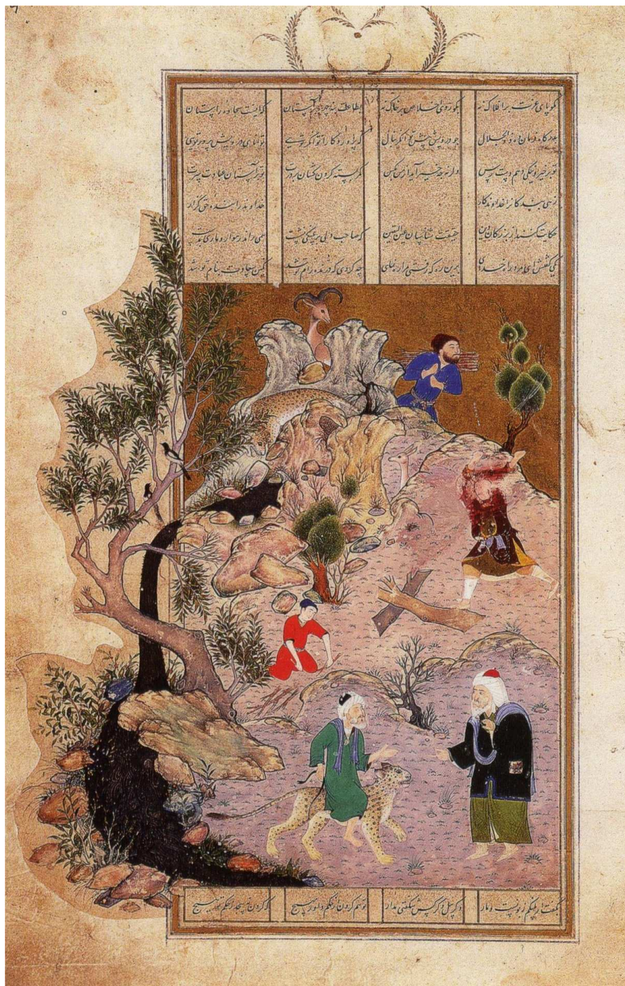
Le Mystique qui chevauchait une panthère Page d'un manuscrit du Bustân de Sa'idi (Herat, 1525) Washington D. C., Arthur M. Sackler Gallery, Smithsonian Institution