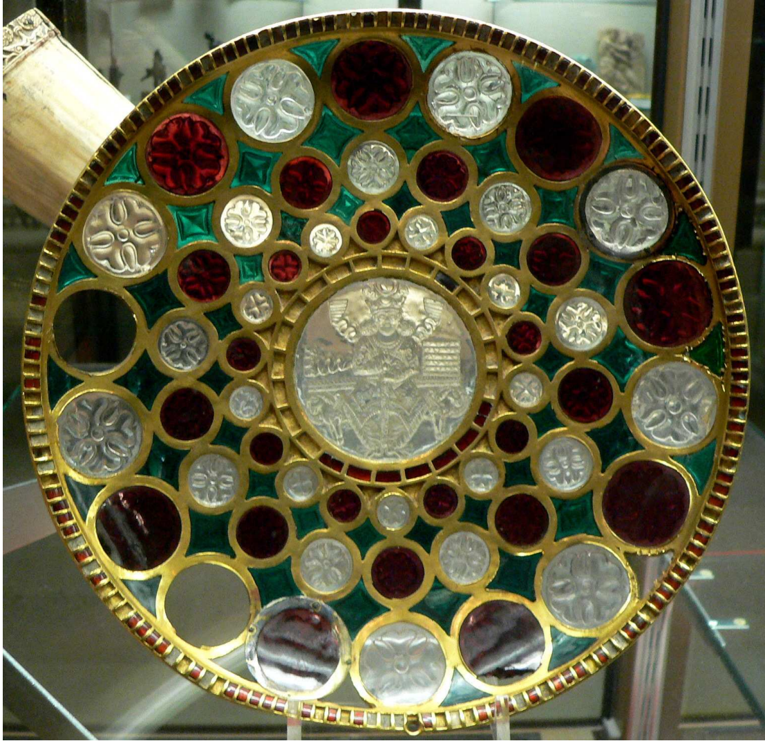
Coupe de Chosroes, VI e -VIII e siècle Cabinet des médailles, Bibliothèque National de France