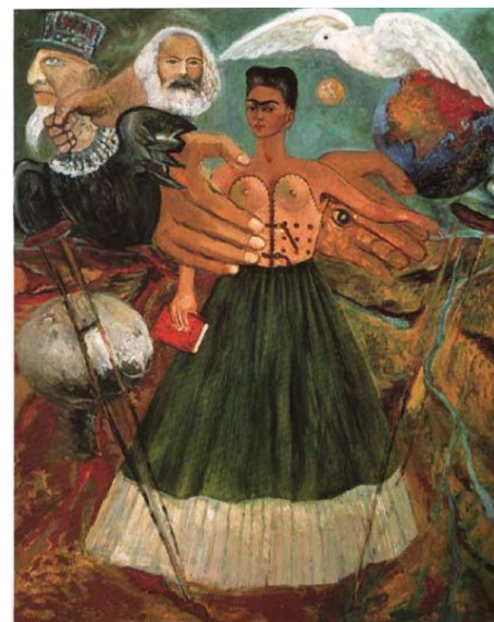
O marxismo trará saúde aos enfermos