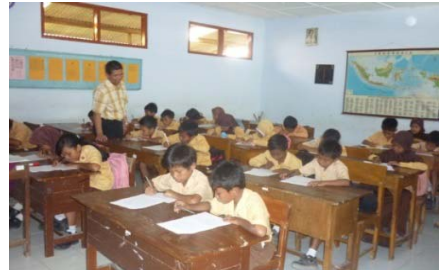
Gambar. 1 Pendampingan Membaca Cerita di Kelas