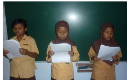
Gambar.2 Bermain Drama di Kelas