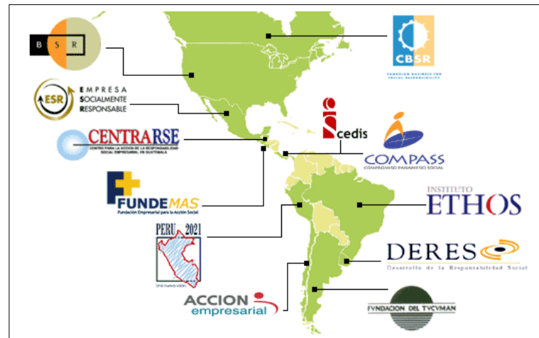
Figura 1 SOCIOS DE EMPRESA