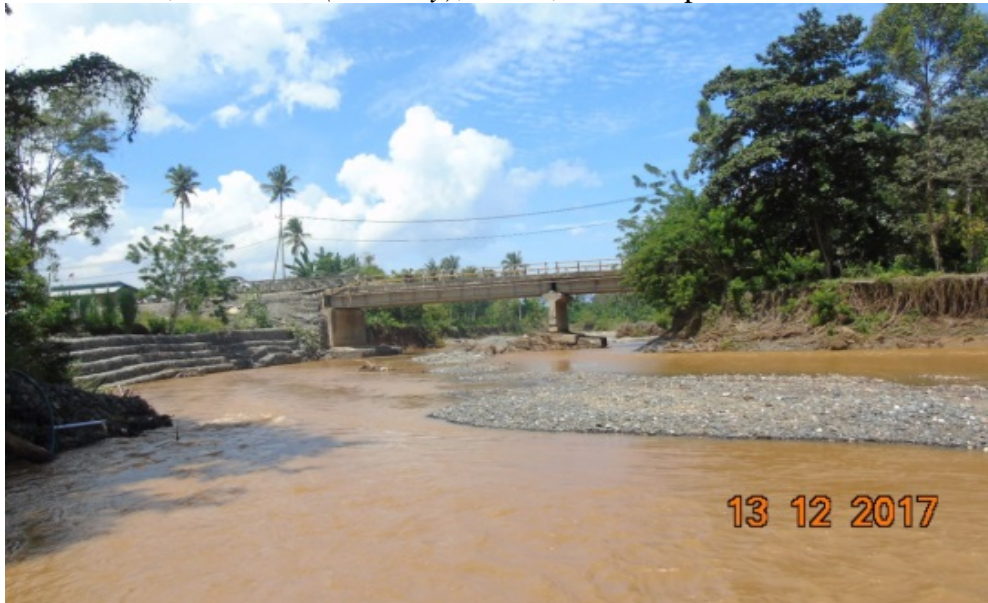
Gambar 3. Foto perubahan warna air sungai yang terjadi di daerah penelitian

Selain perubahan topografi, penurunan kualitas air permukaan juga menjadi salah satu jenis kerusakan komponen abiotik yang dikaji di daerah penelitian. Air sungai yang mengalir di Daerah Aliran Sungai (DAS) Bahodopi dapat diketahui potensi kerusakan salah satunya dari analisis kualitas airnya. Kualitas air dari suatu perairan dapat dipresentasikan dari parameter fisika dan kimia. Parameter fisika yang digunakan antara lain suhu, kekeruhan, warna dan TSS. Parameter kimia yang digunakan adalah pH. Parameter kualitas air tersebut, beberapa dapat menunjukkan tanda-tanda terjadinya penurunan kualitas air, seperti pada perubahan suhu, kekeruhan ( turbidity ), warna, TSS dan pH.