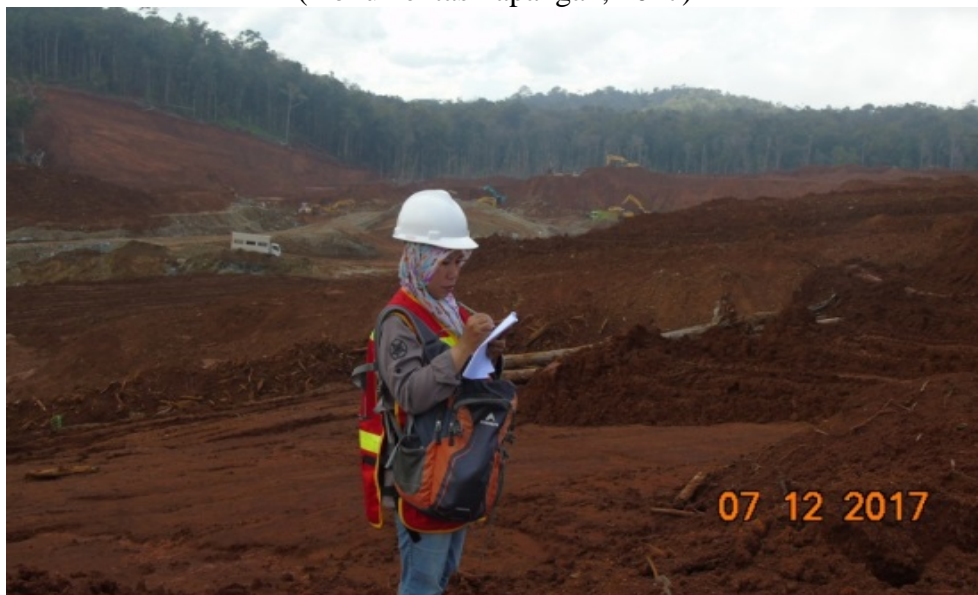
Gambar 2. Kegiatan pengupasan tanah penutup (Dokumentasi lapangan, 2017)