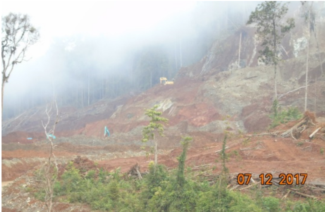
Gambar 1. Kegiatan pengupasan tanah pucuk

Hasil pengamatan kerusakan komponen abiotik di daerah penelitian berupa perubahan topografi (dari yang berbukit menjadi datar dan berlubang). Hal ini terjadi dari proses penggalian dan pengupasan tanah bagian atas ( top soil ) atau dikenal sebagai tanah pucuk dan pengupasan tanah penutup ( overburden ), dengan kedalaman antara 8 meter sampai dengan 25 meter.