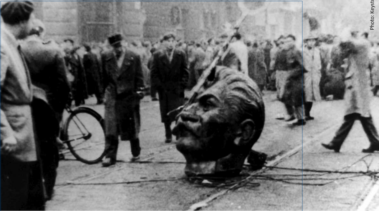
Le 23 octobre 1956, les habitants de Budapest manifestent en masse contre le gouvernement hongrois qui avait fait tirer sur des contestataires estudiantins. La manifestation tourne rapidement à l'émeute et les symboles de l'État communiste sont détruits.

sans courrier. Les prières sont les ponts aériens de tous les ponts aériens. Eux, là-bas, prient aussi. Ils ne combattent pas seulement avec des armes d'acier, mais aussi avec l'arme de l'Esprit. Il me souvient de ce village hongrois, un lundi matin à onze heures, tous les paysans se sont rassemblés dans l'église, il n'y a plus personne aux champs. Puis ils ont écouté la Parole, chanté et prié, avec nous, les deux invités des Églises protestantes de Suisse.