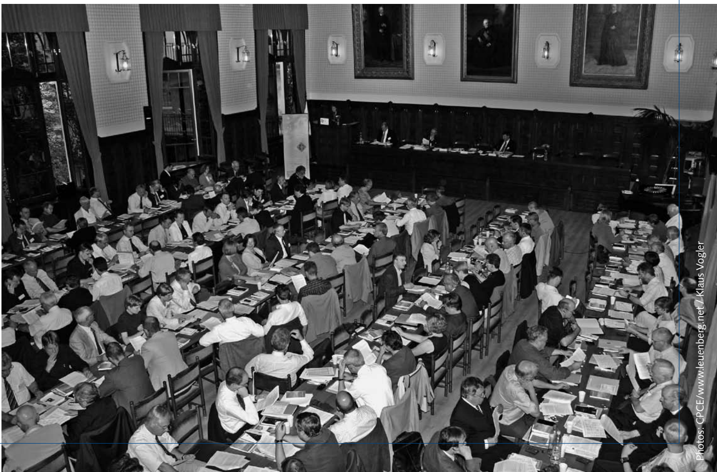
L'assemblée générale dans l'auditoire du Ráday Kolleg à Budapest