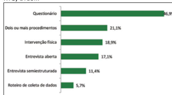
Figura 2. Instrumentos y/o procedimientos de recolección de datos utilizados en investigaciones sometidas a un CEI del municipio de Divinópolis/MG, Brasil.

Tal como indicado en la Figura 2, la gran parte de las investigaciones (46,9%) se realizó a través de cuestionarios. Es común el uso de encuesta y cuestionario en investigaciones de campo, siendo el cuestionario el instrumento más utilizado para la recopilación de informaciones. Él no necesita estar restringido a determinada cantidad de cuestiones, pero se aconseja que no sea muy extenso con el fin de evitar el desánimo del investigado 15 . Vale decir que, entre los investigadores, 27 (21,1%) optaron por recolectar los datos utilizando dos tipos de procedimiento o más, razón por la cual la suma de los porcentajes en la Figura 2 sobrepasa el 100%.