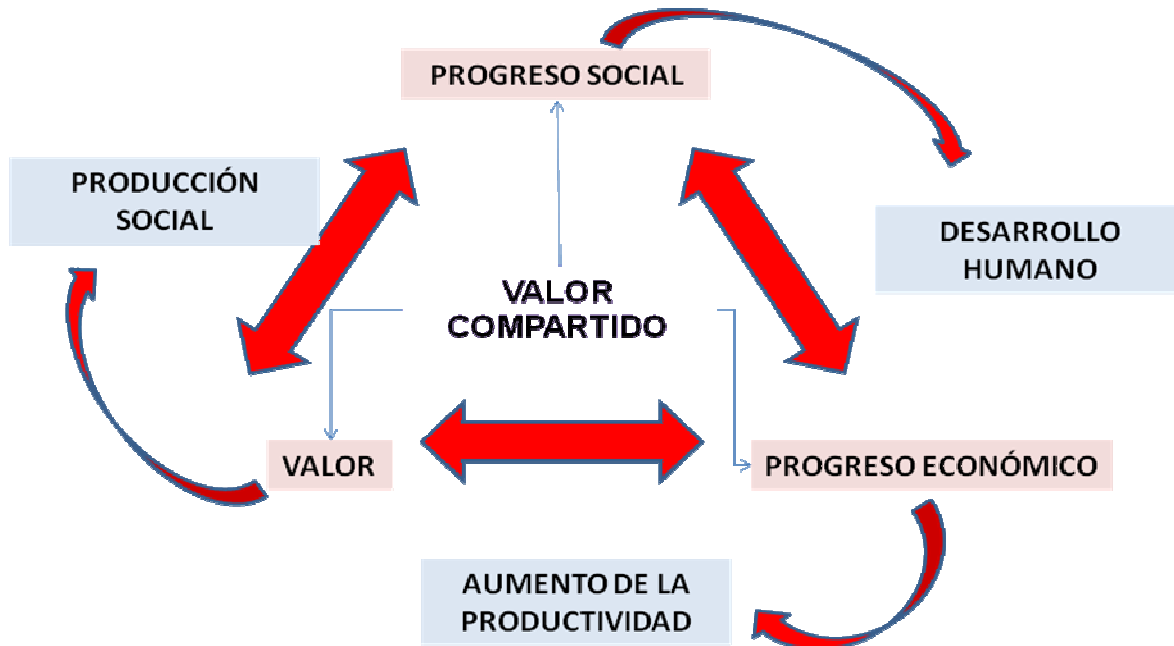
Figura 3. Valor Compartido