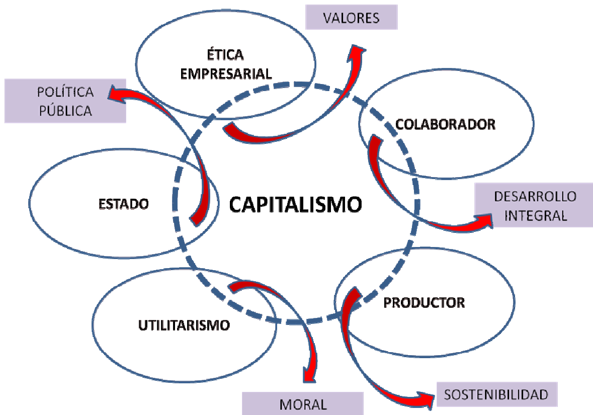
Figura 1. Capitalismo y Utilitarismo