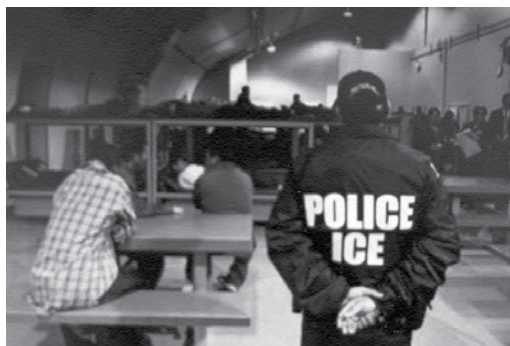
Foto de una foto de la policía migratoria, tomada por Gilda. Reproducida aquí con autorización de Getty Images.

La indignación de Gilda se ha convertido, por medio de su trabajo por la incidencia en las políticas públicas, en acción. En Casa Latina, es una educadora querida, y está lejos del “pequeño mundo” pobre de información de los migrantes en la frontera. A diferencia de ellos, es la mediadora de la información, alguien que trasciende las fronteras tendiendo puentes en apoyo a los migrantes en Casa Latina y en EE.UU. Sus prácticas de información incluyen la búsqueda de una voz política y de una participación fortalecida en la arena pública, siendo ambos rasgos característicos de la etapa de integración de la migración (Caidi et al., 2010).