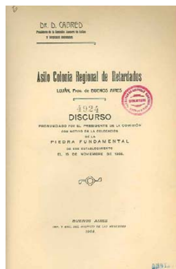
Figura 3. Portada del Discurso pronunciado por el Presidente de la Comisión con motivo de colocación de la piedra fundamental del Asilo Colonia Regional de Retardados el 15 de noviembre de 2008. Impreso y encuadernado en el Hospicio de las Mercedes. Buenos Aires.

“...estará destinada a la asistencia y educación de retardados de ambos sexos, cualquiera que sea el grado y la forma de insuficiencia psíquica. Los anormales leves, los medianos y profundos, apáticos, inestables, amorales, con parálisis, con crisis convulsivas o delirantes, adaptables todos al medio escolar y al medio social, se hallarán aquí agrupados y distribuidos convenientemente en las diferentes secciones y subsecciones de que se compone el Instituto” (Argentina, Asilo Colonia Regional de Retardados, 1908, p.13)