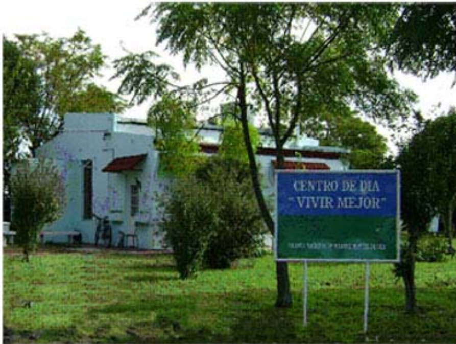
Figura 5. Colonia Nacional Manuel Montes de Oca. Imagen del Centro de Día Vivir mejor, inaugurado durante el año 2006. Noviembre de 2008.