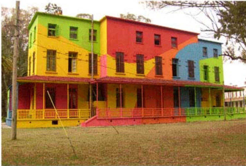
Figura 4. Colonia Nacional Montes de Oca. Imagen del Pabellón N° 1 remodelado y refuncionalizado arquitectónicamente por el Arquitecto Gustavo Navone en el año 2008. Noviembre de 2008.

incorporando mediante la pintura exterior e interior una inédita comunicación visual en la cual predominan colores vivos, que otorgan singularidad y atractivo a estructuras edilicias deterioradas y con predominio de matices grises y escasa expresividad plástica; un factor este que ha provocado una generalizada aceptación entre pacientes y personal de la Institución.