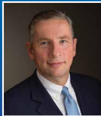
KLAUS KLEINFELD, Chủ tịch Hội đồng Quản trị kiêm Tổng Giám đốc