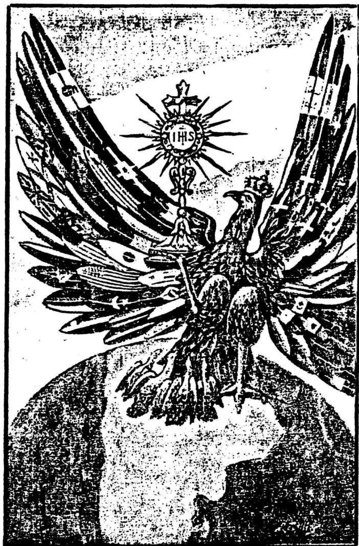
Fig.3: Tarjeta postal del Congreso Eucarístico Internacional