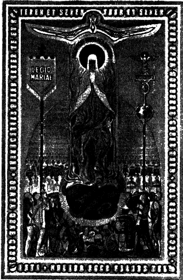
Fig.2: Legio Mariae

según el simbolismo sugerido por Inocencio III cuando se fundó la orden de los Trinitarios.