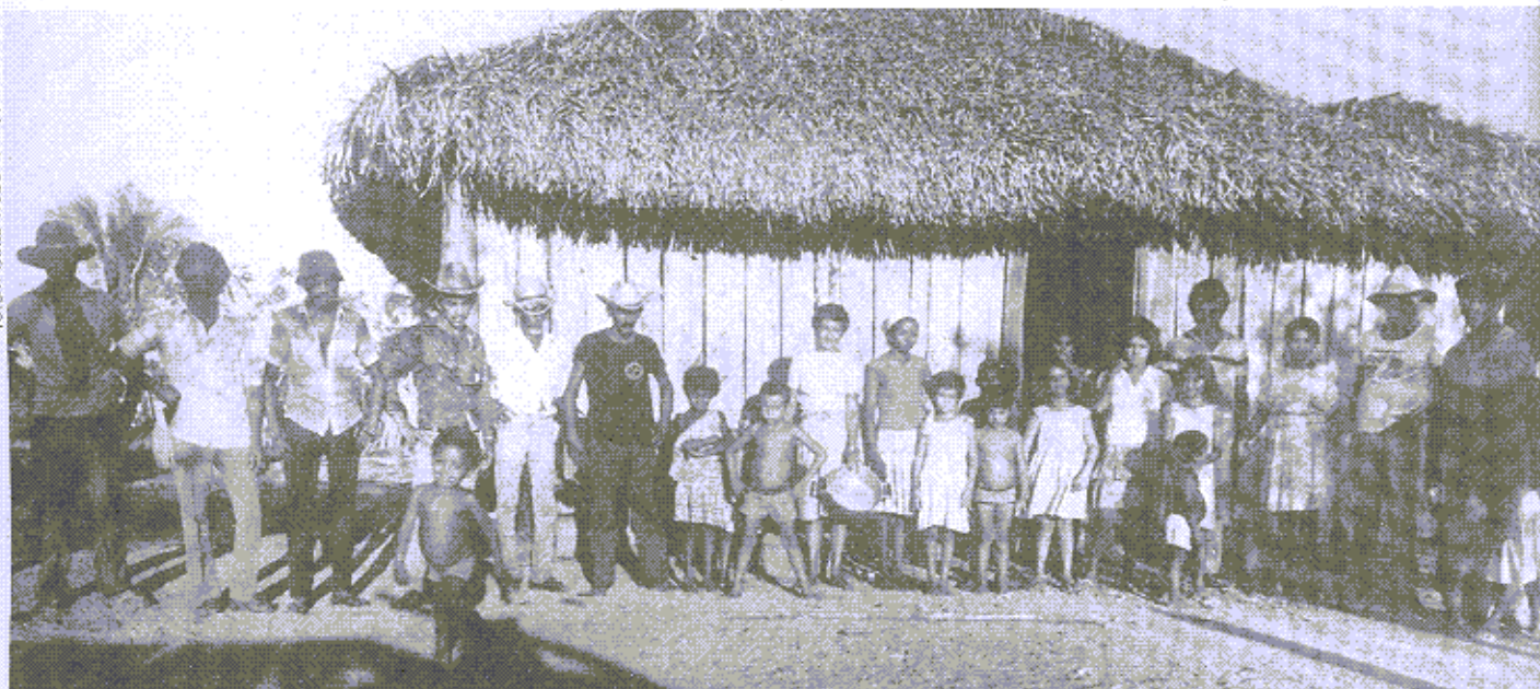
Muitos trabalhadores migraram em busca de um lote de terra na Amazônia: Gleba Caxias do Sul, Linguara (PA).