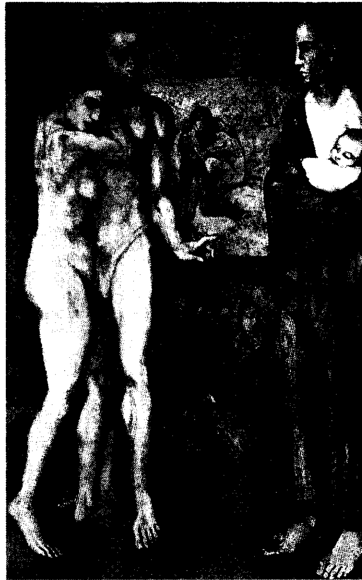
La vida. por Picasso; 1903-1904

Eutanasia, reanimación, encarnizamiento terapéutico, vida digna, muerte digna, la verdad para el paciente, autonomía; aborto, diagnóstico prenatal, reproducción médicamente asistida, consejo genético, eugenesia, experimentación con embriones o con seres humanos, manipulación genética, suicidio, suicidio asistido, transplantes, trans -sexualidad, uso y distribución de los recursos económicos para la atención de la salud y muchos otros que se ha ido extendiendo hasta comprender la ecología y la contaminación del ambiente.