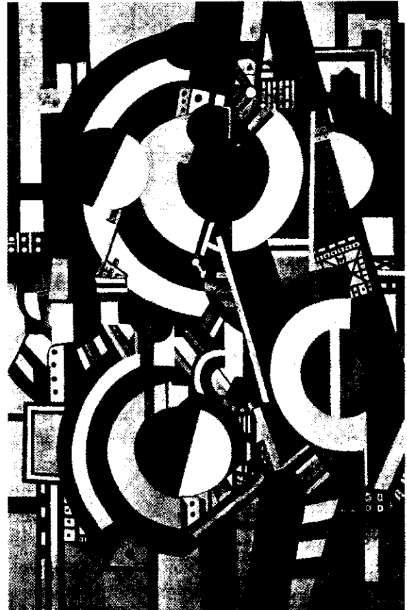
Los Discos . de Fernand Léger. 1917